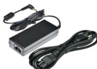
Сетевой адаптер 65 Вт со шнуром