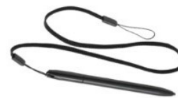
Стилус на привязи