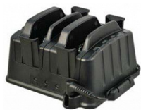
Зарядное устройство для батарей - 2 отсека