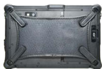
X-образный ремень на ладонь