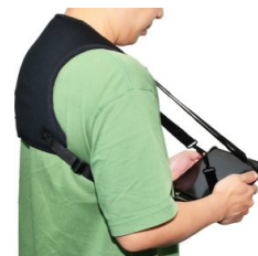
Плечевой ремень (4х точечный)