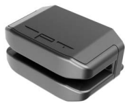
Устройство считывания магнитных карт