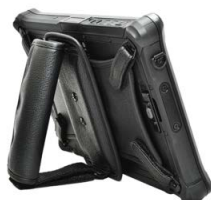
Вращающийся ремешок с подставкой