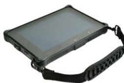
Ремешок на руку