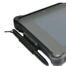
Держатель для стилуса