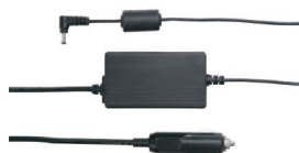
Автомобильный адаптер (11-27 В пост. тока)