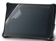
Защитная пленка для экрана